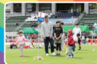
グラウンド・ゴルフ

屋外:陸上競技場:9:30~16:00 屋内:メインアリーナ、サブアリーナ、ダンス室 午前の部:9:30~12:00、午後の部:13:30~16:00