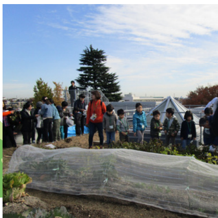
食育講座 スーパーでの買い物体験