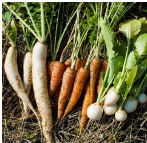
農園での収穫体験